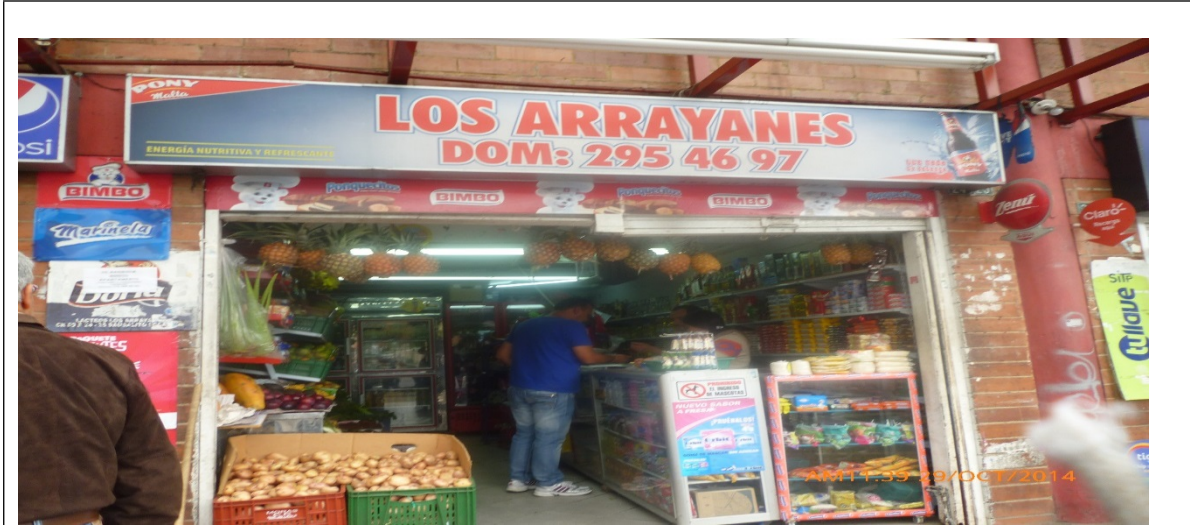
Registro fotográfico, Visita No. 2 efectuada el día 09/06/2015

ALCALDÍA MAYOR DE BOGOTÁ D.C. SECRETARÍA DE AMBIENTE